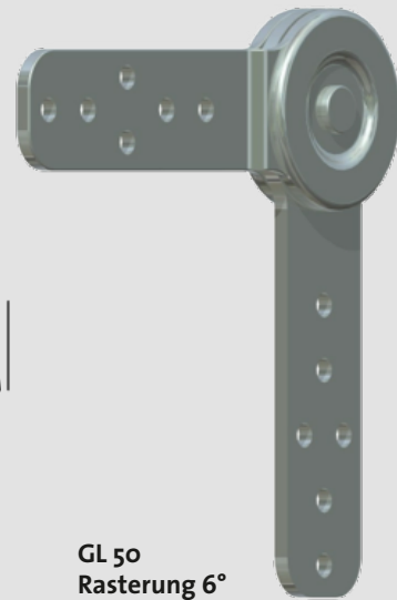
GL 50 Rasterung 6°