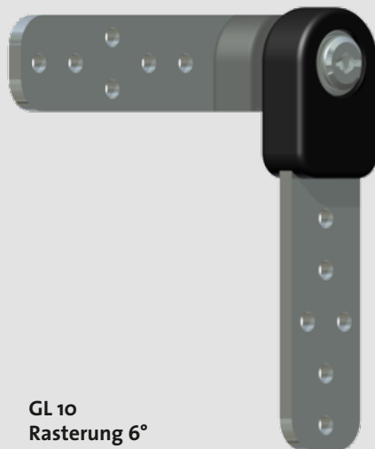
GL 10 Rasterung 6°